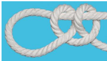
Dobbelt halvstik om egen part

Benyttes til at binde et tov fast på en pæl eller lignende