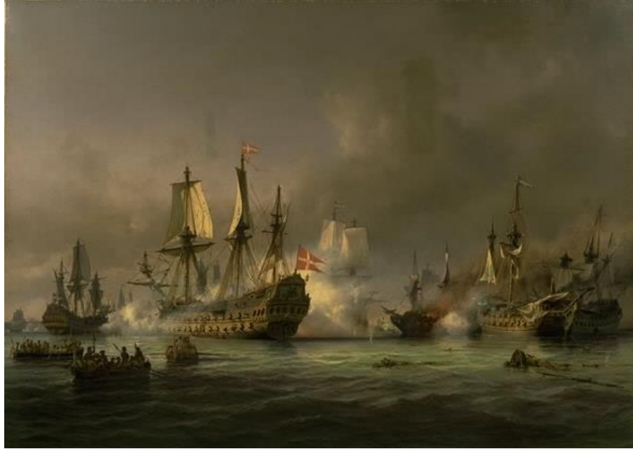
Slaget i Køge Bugt 1677

Senere i slaget gennembrød Niels Juel som den første kommandør i søkrigshistorien modstanderens linje og vandt det søslag, som skulle indskrive ham i danmarkshistorien.