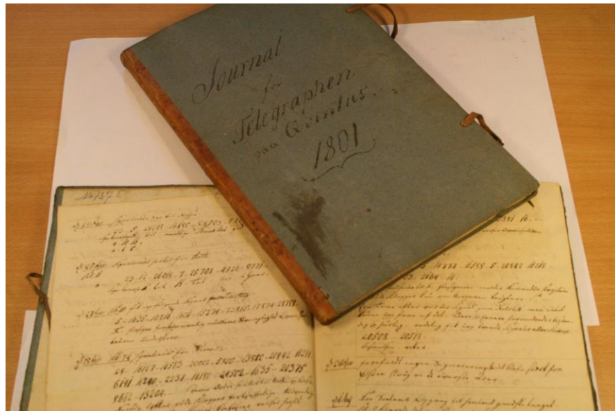
Opslået bog er resterne af journalen fra telegrafstationen på Løgtehøj. Henover ses forsiden på journalen fra Quintus. (hovedstationen i København)

Afsejlede i gaar eftermiddags efter ordre til Tornebusken 11 . I Dagbrækningen var jeg tæt hos svenske Flode rangeret til Ankers tæt ved Tornebusken. Nu i Aften under Floden, 24 Linieskibe stærk.