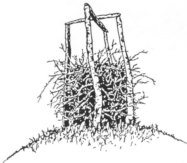
Baun klar til antænding

Der har formodentlig også været tændt en baun på bronzealderhøjen på Bautavej 11, når der var ufredstider i landet. Høje punkter i terrænet har altid haft strategisk betydning til observation og signalering.