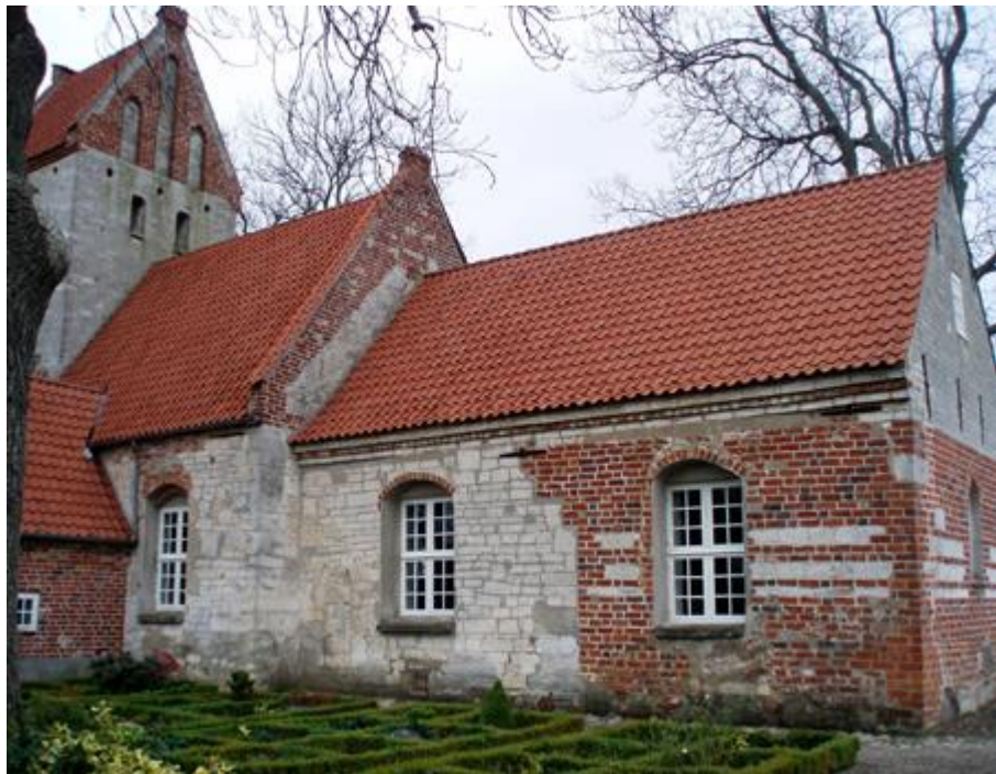
Varpelev Kirke med kridtsten fra Stevns klint

Der findes mange fund fra bosættelser på Stevns, bl.a. langs Tryggevælde Å, som tidligere har været sejlbar for ret store skibe, og udgravninger viser, at der har været egentlige værftsanlæg langs åen og ved Varpelev et trehundrede meter langt broanlæg over åen. Fra Stevns har de danske vikinger kunnet drage i ledning mod fjenderne i Østersøen. Biskop Absalon var i spidsen, og senere var det fra Stevns Klint, at biskop Absalon hentede kridtsten til den første befæstning i København. Mange gårde på Stevns er bygget af samme kridtsten og overalt på Sjælland ses kridtsten fra Stevns i kirkerne.