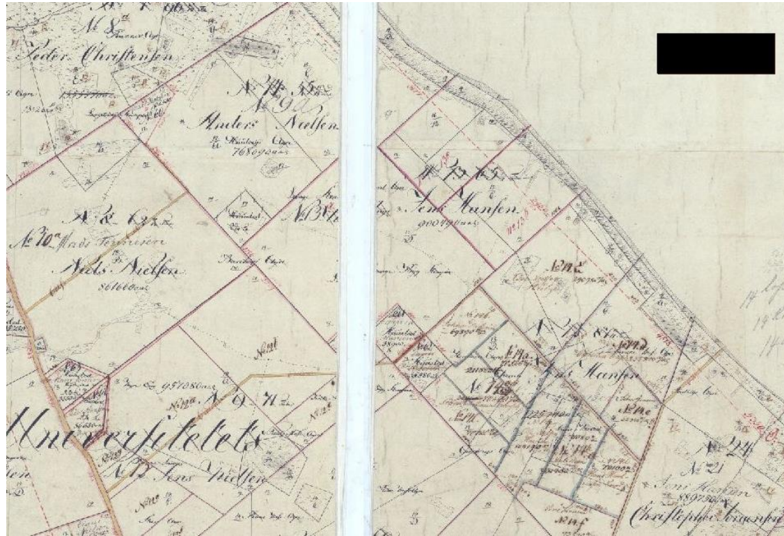
Matrikelkortet som sætter matr.nr. 13 på Unge Jens Hansens lod nr. 13 (lod nr. 13 Lemgaarden ses i kortets midte henover folden)

olgte godset gårdene til fæsterne ved arvefæsteskøder, og så rykkede de op som stand og blev betydningsfulde både kulturelt og politisk.