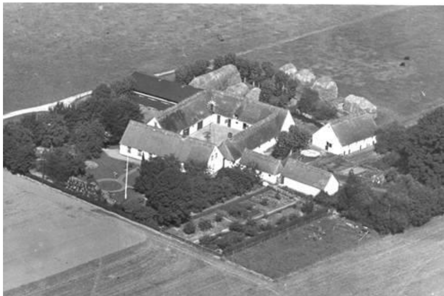
Lemgaarden før 1952