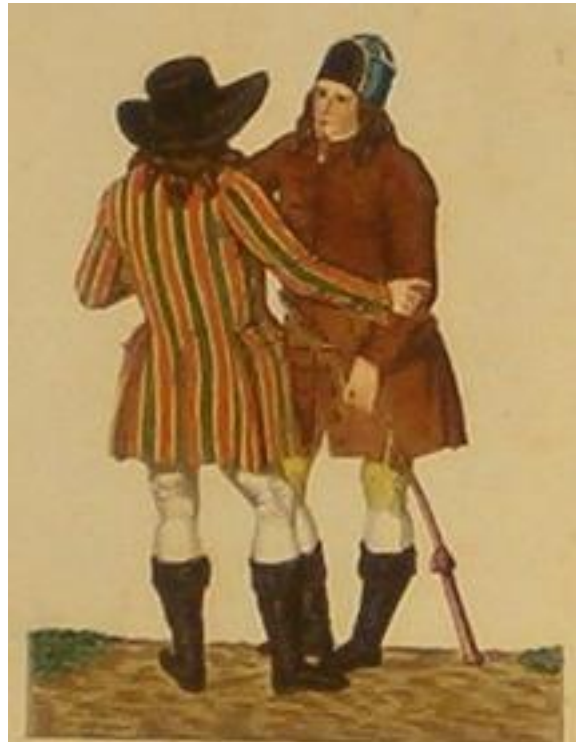
Sjællandske bønder fra Køge kanten. ca. 1800