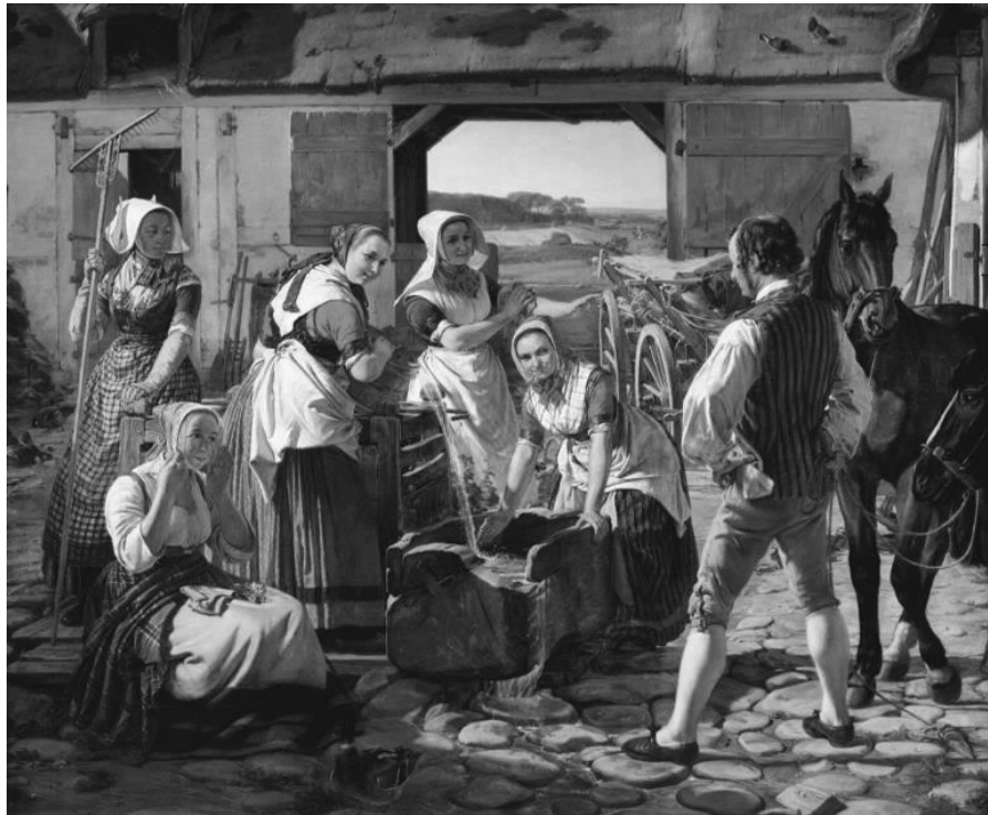
Sjællandske høstpiger ved en brønd 1850